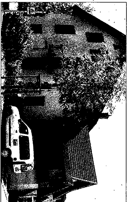
Zahlreiche Kurse und Veranstaltungen finden im Familienzentrum im Ernst-Friedrich-Gottschalk-Weg statt.

Am Samstag, 11. September, findet wieder ein Marktstand mit Kuchenverkauf unter der Leink-Plastik statt. Kinderhaarschnitte zu familienfreundlichen Preisen werden wieder am 22. September von 15 bis 17 Uhr angeboten. Anmeldungen unter ☎ 07622-673804 oder info@familienzentrum-schopfhelm.com .