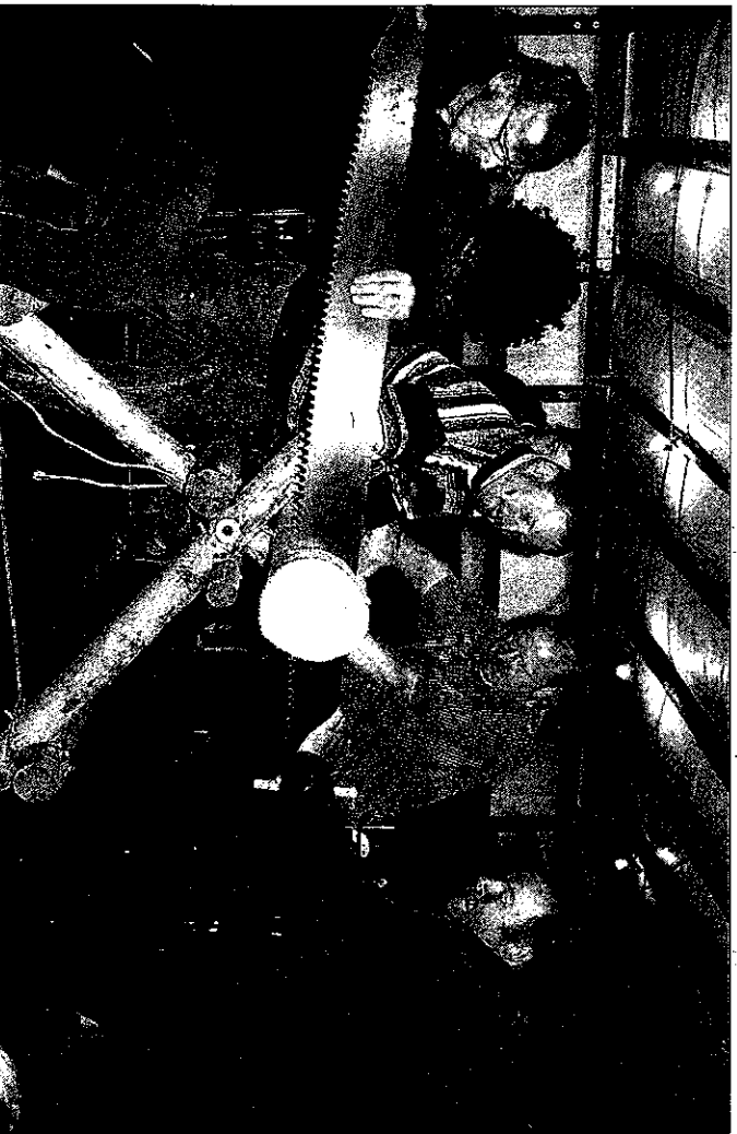
Highlight beim Mambacher Dorfhock dürfte auch dieses Mal das Wertsägen für jedermann sein.