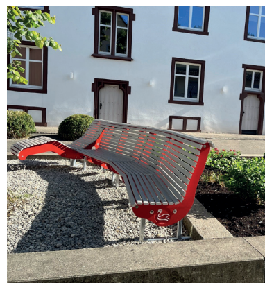
Kunstwerk: Embruner Wand; Stadtmitte Zell