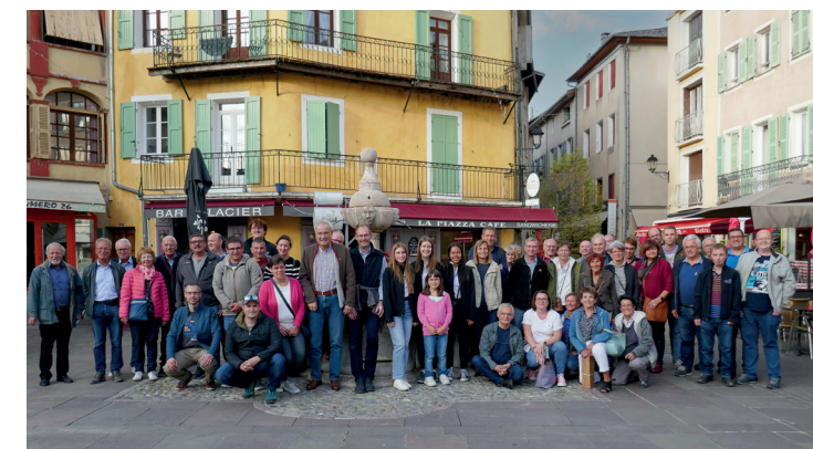
Gruppenbild von der Jubiläumsfeier in Embrun.

Vom 23. bis 25. September 2022 feierten 68 Zellerinnen und Zeller zusammen mit den Bürgern aus Embrun die 40-jährige Städtepartnerschaft in Embrun. Die Teilnehmer setzten sich aus zahlreichen Vereinen wie Feuerwehr sowie Stadtmusik als auch Verwaltungsmitarbeitern, Gemeinderäten und Zeller Bürgern zusammen. Trotz einiger sprachlicher Hürden wurde gemeinsam gefeiert und gelacht. Neben den offiziellen Reden und Programmpunkten wurden vor allem private Kontakte und Freundschaften gepflegt und neu geknüpft.